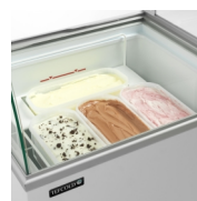
Scooping basket option