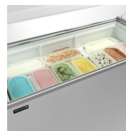
Scooping basket option