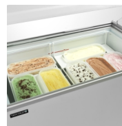
Scooping basket option