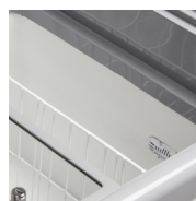
Revêtement interne blanc