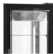
Porte sans cadre